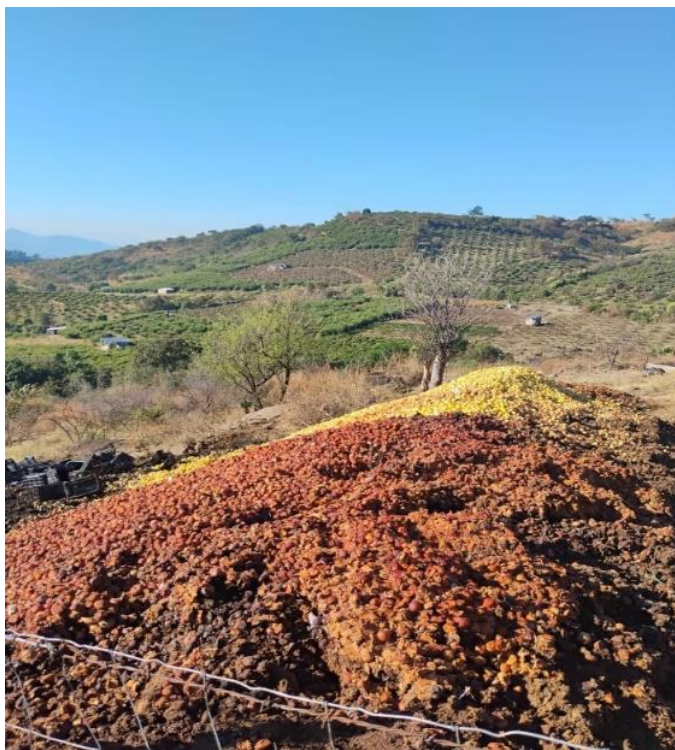
Figura 4. Pérdida postcosecha directa de guayaba en parcelas agrícolas de Michoacán.

Entonces, la pregunta cambia. En este sentido, el punto no es si pueden usarse los desperdicios sino por qué se usan tan poco. Parte de la respuesta puede deberse a la falta de organización y la poca conexión entre agricultores y empresarios. Aun así, en Michoacán, donde la producción es alta y constante, las condiciones están dadas para cambiar esto (Suárez-Toledo et al. 2022).