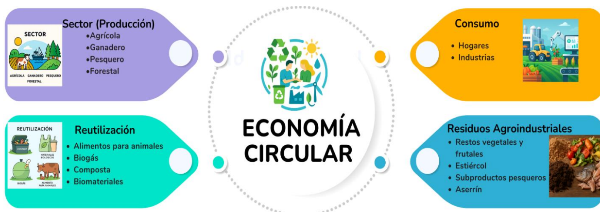
Figura 1. Funcionamiento de la economía circular en cadenas agroindustriales.

“En Michoacán, destaca su producción frutícola, como las de aguacate, guayaba, fresa y zarzamora, que generan no sólo alimentos sino también grandes volúmenes de subproductos como cáscaras, semillas y pulpas.”