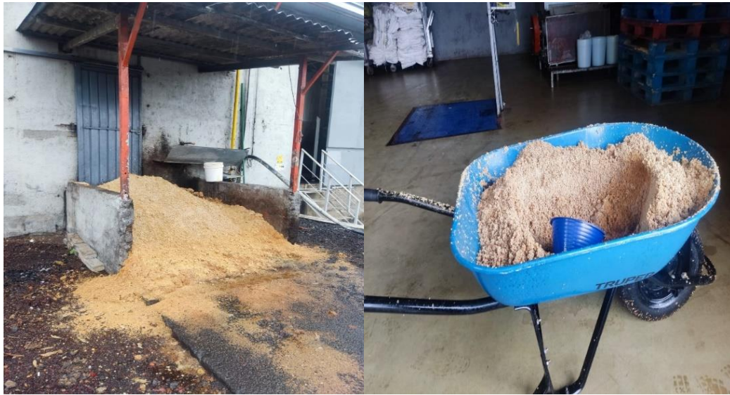
Figura 3. Desperdicio de semilla de guayaba separada en la industria regional de Michoacán.

“Entre los residuos agroindustriales, los de la guayaba son relevantes por algo muy simple: hay mucho y tienen gran valor. Durante su industrialización que produce principalmente jugos o dulces, una parte importante del fruto (semilla o bagazo) se desperdicia.”