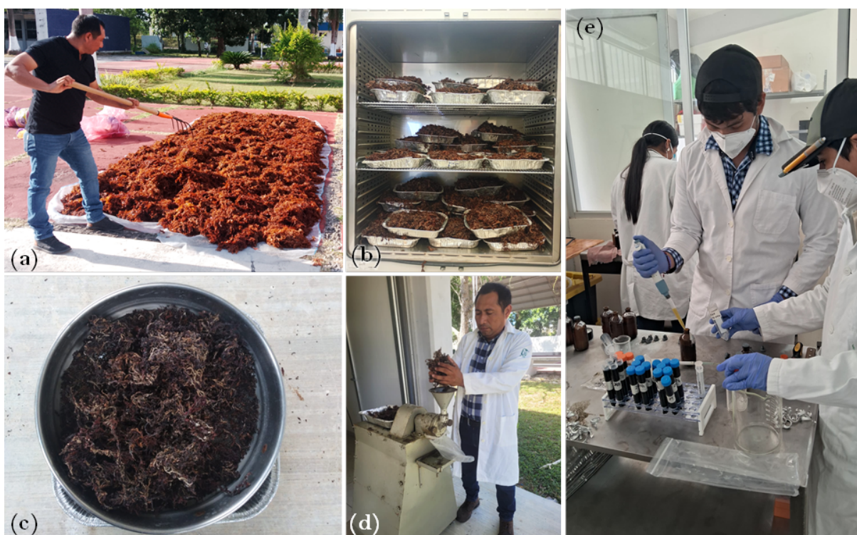
Figura 3. Procesamiento del sargazo para su conversión en harina. a y b , secado al sol y en estufa. c , cribado para eliminar el exceso de arena. d , molienda a un tamaño de partícula de 1-2 mm. e , experimento de producción de gas in vitro para su evaluación nutritiva.

En términos de efectividad, la inclusión de varias especies de sargazo a las dietas de rumiantes puede reducir la producción de metano hasta en 40%, aunque los resultados son variables (Choi et al. 2020). Hasta el momento, la respuesta animal en la reducción de metano es nula. En la India, vacas que consumieron sargazo S. johnstonii no manifestaron diferencias en la producción de metano (Singh et al. 2014). Sin embargo, la inclusión de hasta el 20% de algas pardas a las dietas mejoró la ganancia de peso y la producción de leche en ovejas y vacas (Singh et al. 2014; Ellamie et al. 2020).