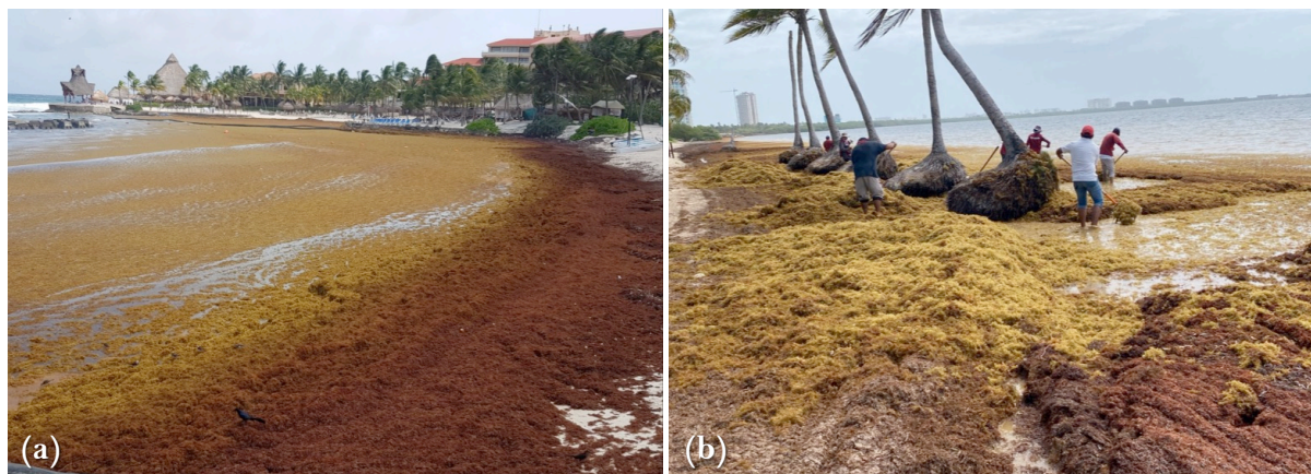
Figura 2. a , representación de la acumulación de la biomasa de sargazo en playas de Cancún, y b , trabajos de recolecta de sargazo por personal civil.

La inclusión del sargazo en la dieta de rumiantes es una alternativa viable a largo plazo que podría impulsar la industria ganadera y, simultáneamente, reducir el impacto ambiental que ocasiona en las costas. Para ello, el sargazo podría recolectarse en el océano antes de su arribo y descomposición en la playa (Choi et al. 2020; Canul-Ku et al. 2024).