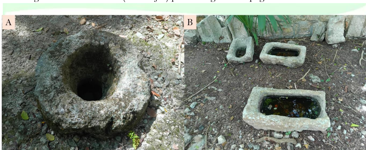
Figura 2. (A) Vista superficial de la boca de entrada de un Chultún en la Zona Arqueológica de Chichen Itzá. (B) Rocas calizas labradas por Mayas como morteros o para el almacenamiento de agua (imagen tomada en la Zona Arqueológica de Chichen Itzá).

Las sartenejas almacenan agua durante la temporada de lluvias. Sin embargo, al no estar conectadas con el acuífero subterráneo, y por su tamaño reducido, la retención de agua es temporal y ésta suele evaporarse durante la temporada seca. Las sartenejas no deben confundirse con los Chultunes , que son estructuras artificiales revestidas con estuco, excavadas por los antiguos mayas para captar y almacenar agua de lluvia (Chávez-Gómez e Icaza-Lomelí 2010) (Fig. 2A). También, es importante diferenciar las sartenejas de ciertas rocas labradas por los antiguos mayas (Fig. 2B) que funcionaban como morteros, aunque en algunos casos pudieron servir también para almacenar agua. Tanto los Chultunes , como las piedras labradas, se distinguen de los Háaltunes (sartenejas) por su origen antropogénico.