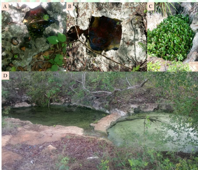
Figura 1. (A) Roca con intemperismo leve y oquedades incipientes (Pisteakal, Tzucacab, Yucatán); (B) Roca con mayor grado de intemperismo y con una sarteneja de mayor tamaño (Pisté, Yucatán); (C) Sarteneja con vegetación durante la temporada de lluvias (Yaxhachén, Oxkutzcab, Yucatán); (D) Sartenejas con mayor grado de desarrollo (Yaxhachén, Oxkutzcab, Yucatán).

Las sartenejas, en maya Háaltun (Fig. 1), “piedra que guarda agua” o “piedra pulida por el agua”, son cavidades formadas por disolución química de roca caliza por el agua de lluvia (Oropeza-García et al. 2025). Su tamaño y profundidad varían según el régimen de precipitación, la porosidad de la roca y el tiempo de exposición al intemperismo. Las sartenejas más amplias las podemos encontrar en zonas del sur del estado de Yucatán, donde las lluvias son más abundantes y el karst es más antiguo, aunque en todo el estado se puede encontrar un mosaico heterogéneo de sartenejas de diferentes tamaños y profundidades.