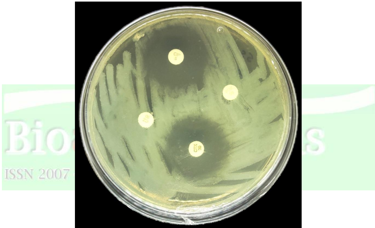
Figura 2. Pruebas de resistencia antimicrobiana con el método de difusión en disco (Kirby-Bauer). Se distinguen halos de inhibición de diámetros distintos alrededor de los discos impregnados con cuatro tipos de antibióticos. La ausencia de halo en ciertos discos evidencia mecanismos de resistencia activos frente a antibióticos específicos.

“La resistencia antimicrobiana es la capacidad de bacterias para sobrevivir o multiplicarse ante un antibiótico que antes las eliminaba.”