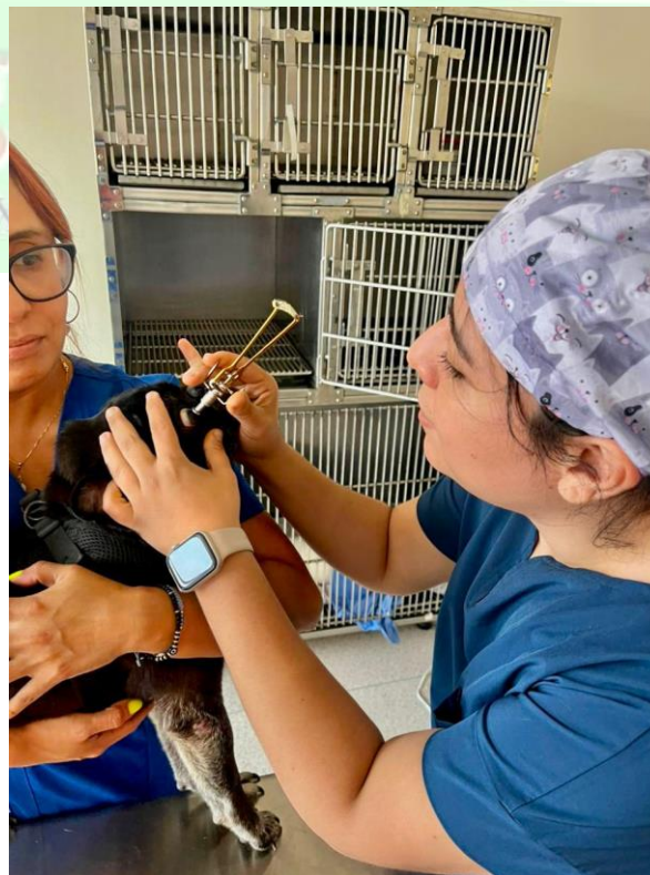
Figura 1. Los cuidados paliativos son de mucha importancia al final del ciclo de la vida, ya que las mascotas pueden llegar a padecer enfermedades terminales que limitan su vida cotidiana y éstas tienen que ser revisadas por un médico veterinario.