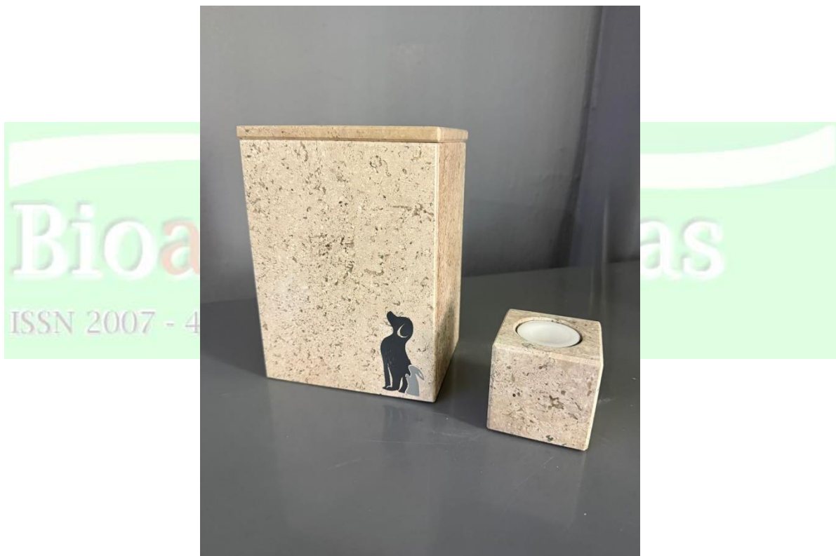
Figura 3. El resguardo de las cenizas en un lugar seguro también es una opción de duelo en propietarios.

Si la mascota fue querida, puede estar presente toda la familia durante la eutanasia, o al menos las personas que no quieren que fallezca sola. Al finalizar el acto, se debe considerar qué se hará con el cuerpo y ofrecer opciones como un cementerio en casa o resguardo de las cenizas en un lugar seguro (Fig. 3). Adquirir o no una nueva mascota después de su ausencia, depende de forma individual, y cada persona debe hacer lo que le ayude a sentirse mejor (Park y Royal 2020).